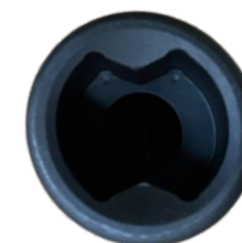
*Nøglehuls-lignende el. sommerfugl